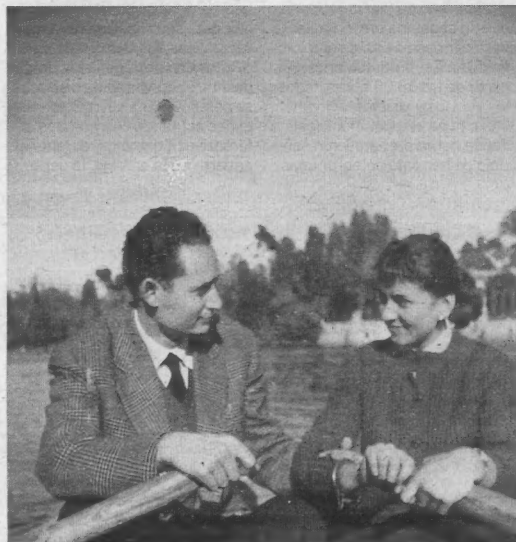
El escritor jerezano, en una barca de El Retiro de Madrid, con una amiga.